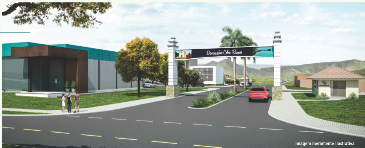
Pórtico de Entrada

Uma Nova Governador Celso Ramos está nascendo. Um loteamento com áreas dedicadas ao uso residencial, comercial e industrial , com facilidade de acesso, contato com a natureza e valorização do seu imóvel. Possui localização estratégica e infraestrutura completa em uma das cidades que mais cresce na região da Grande Florianópolis. Invista na Nova Governador Celso Ramos.