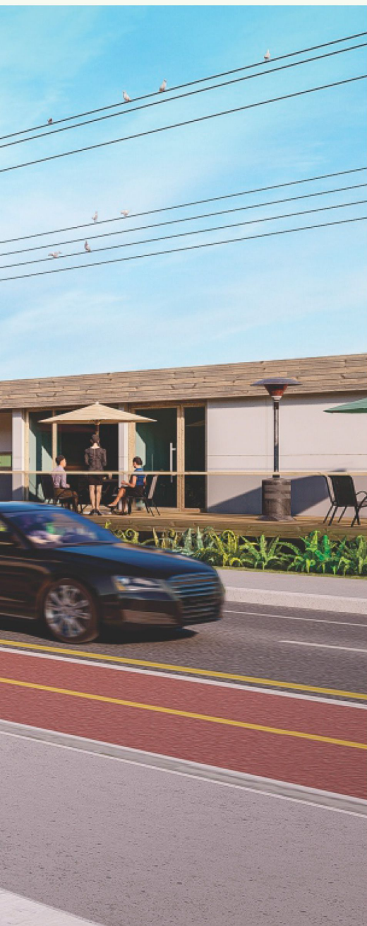
Avenida do Estado