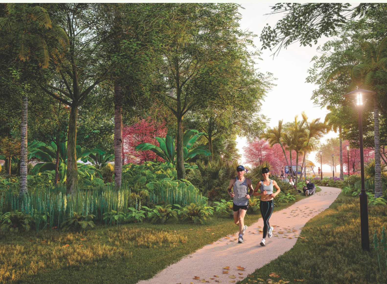
Bosque com pista de caminhada